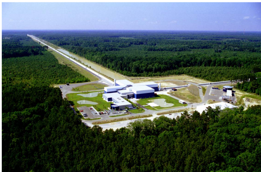
1. ábra. A LIGO livingstoni detektorának képe madártávlatból.

A gravitációs hullámok első közvetlen detektálására pedig az általános relativitáselmélet publikálása után majdnem 100 évet kellett várni. 2015. szeptember 14-én a két amerikai LIGO gravitációshullám-detektor először észlelte két fekete lyuk egymás körüli keringését és összeolvadását. A LIGO detektorok 4 km-es karhosszúságú, L-alakú, Fabry–Perot-üregekkel felszerelt Michelson-interferométerek, amelyeket az