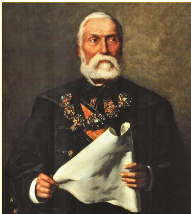
2. kép. Paczka Ferenc (1856–1925) Trefort Ágostonról készített festménye (részlet), a Magyar Nemzeti Múzeum tulajdona.