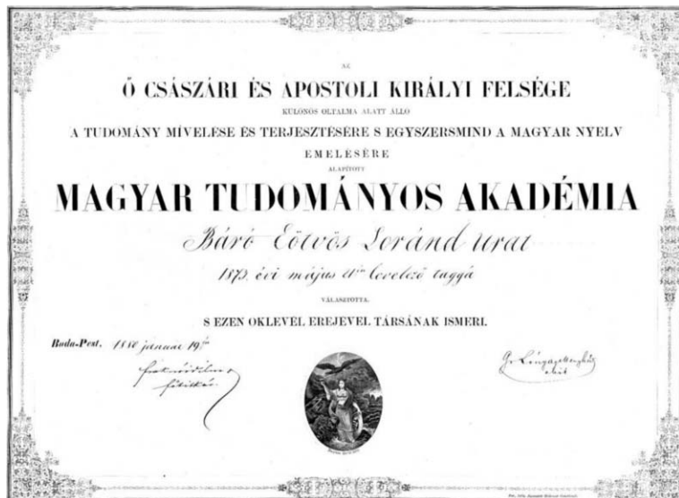
5. kép. Oklevel akadémiái levelező tagságáról, 1880.

Ezt követően esett a választás a fiatal Eötvös Lorándra, aki ekkorra már Európa-szerte neves fizikusnak számított.